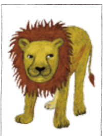
*背景はかかないでね

*上記ルールに当てはまらない場合、採用できない可能性がありますので、くれぐれもご注意ください